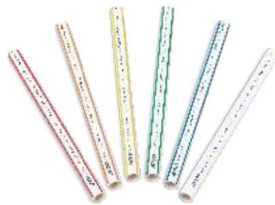
Ống có vạch màu

Để đặt ống màu thêm ký hiệu màu vào cuối của mã sản phẩm. Màu đỏ (DO), màu cam (CA), màu vàng (VA), màu xanh lá (XL), màu xanh dương (XD). Ví dụ: SP9032/CA